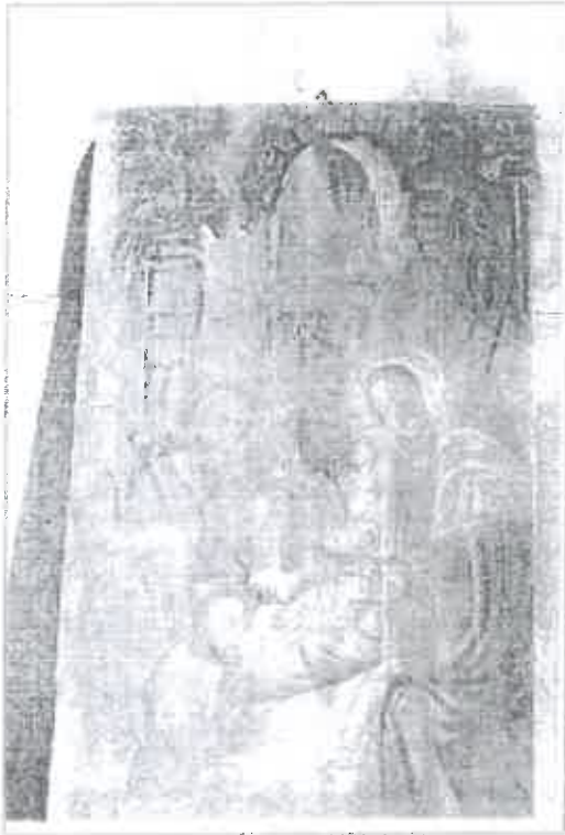
Imagen: Vista General