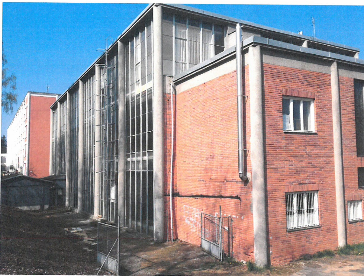
Zlín, Památník Tomáše Bati