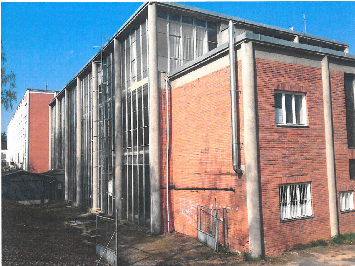
Zlín, Památník Tomáše Bati