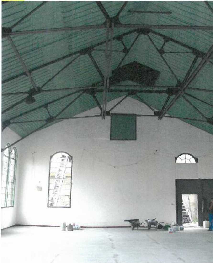
Budova strojovny těžního stroje č. 1 jámy Terezie (areál P. Bezruč), kulturní památka - rejstř. č. USKP: 12580/8-3523 parc. č.: 2368, kat. území – Slezská Ostrava