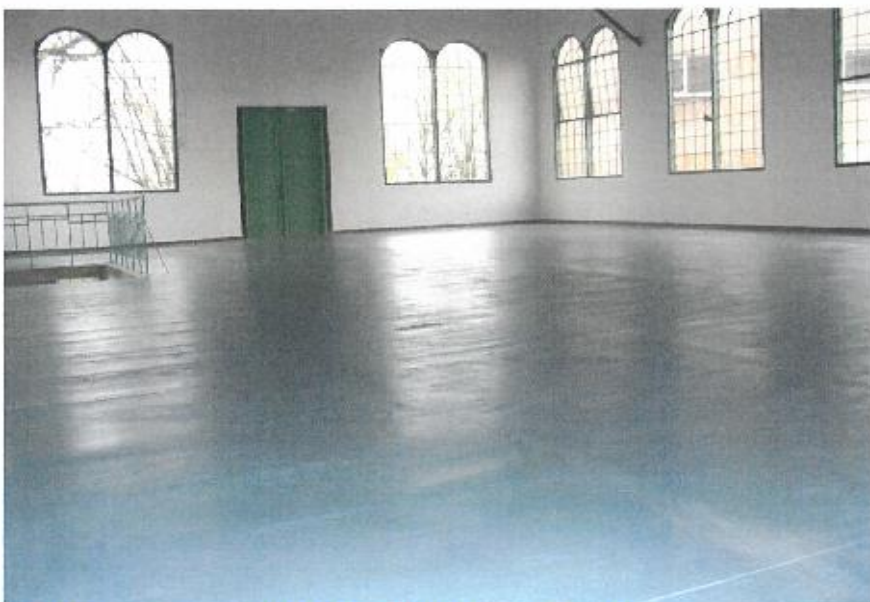
Budova strojovny těžního stroje č. 1 jámy Terezie (areál P. Bezruč), kulturní památka - rejstř. č. ÚSKP: 12580/8-3523 parc. č.: 2368, kat. území – Slezská Ostrava