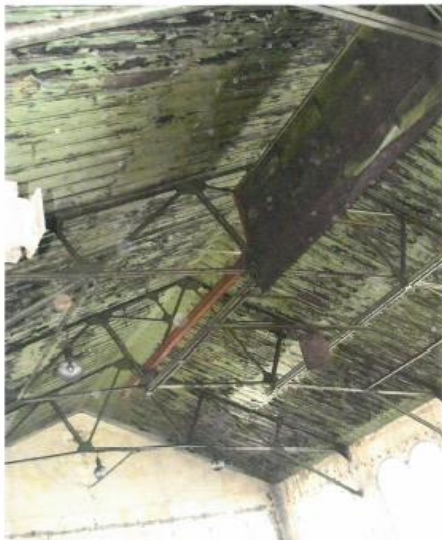
Budova strojovny těžního stroje č. 1 jámy Terezie (Janek P. Bezruč), kulturní památka - rejstř. č. ÚSKP: 12580/8-3523 parc. č.: 2388, kat. území – Slezská Ostrava