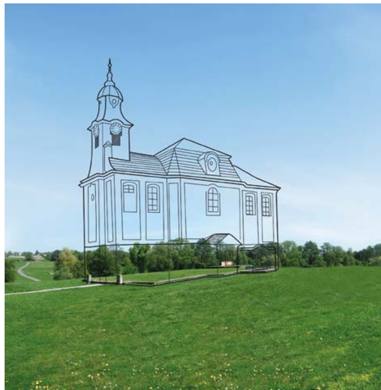
Skica 3D modelu kostela sv. Martina ve starých Lidicích

Virtuální realita je aplikace, která je nás schopna přenést do již neexistujícího virtuálního vymodelovaného prostředí a volně se v něm pohybovat a prohlížet si jej. Virtuální realitu lze umocnit zobrazením jakýchkoliv konkrétních informací, dokumentů, podtrhnout atmosféru hudbou či dobovými záběry atp. Tento postup bychom rádi využili a vytvořili sérii scénářů edukačních programů.