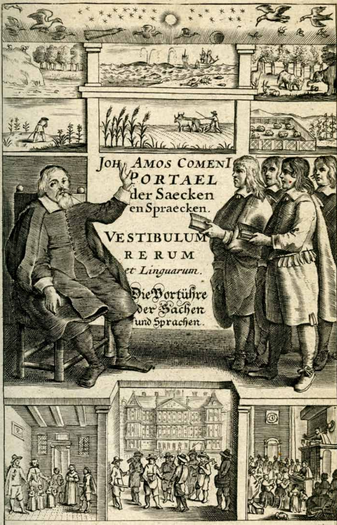
AMSTELODAMI, Apud Joannem Ravesteinium. 1673.