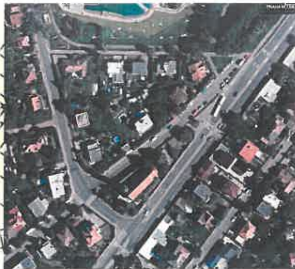
situace 1938 a 2021 ( http://www.dveprahy.cz/ )