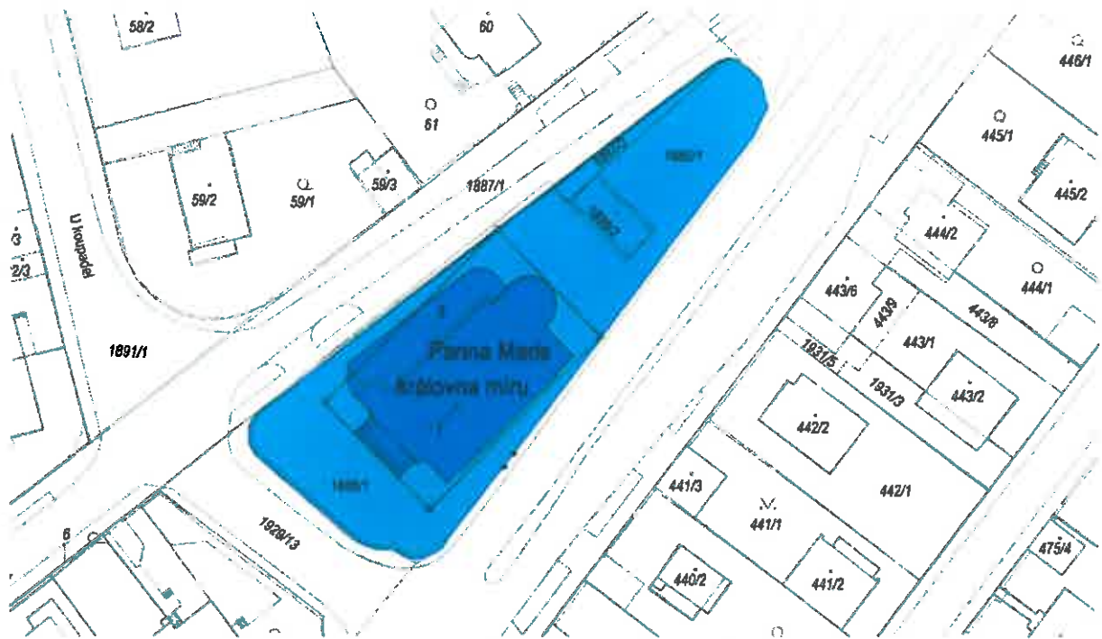
vyznačení rozsahu navrhovaného areálu KP