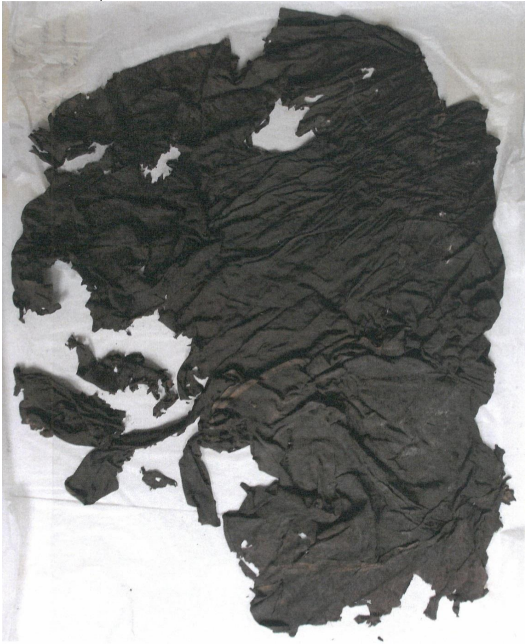
Pohřební rubáš před restaurováním