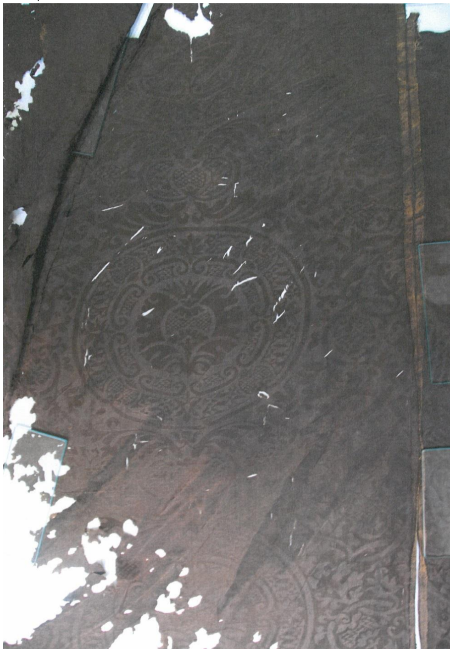
Vzor pohřebního rubáše z rubu