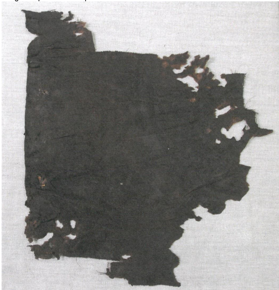
Fragment předního dílu pohřebního rubáše