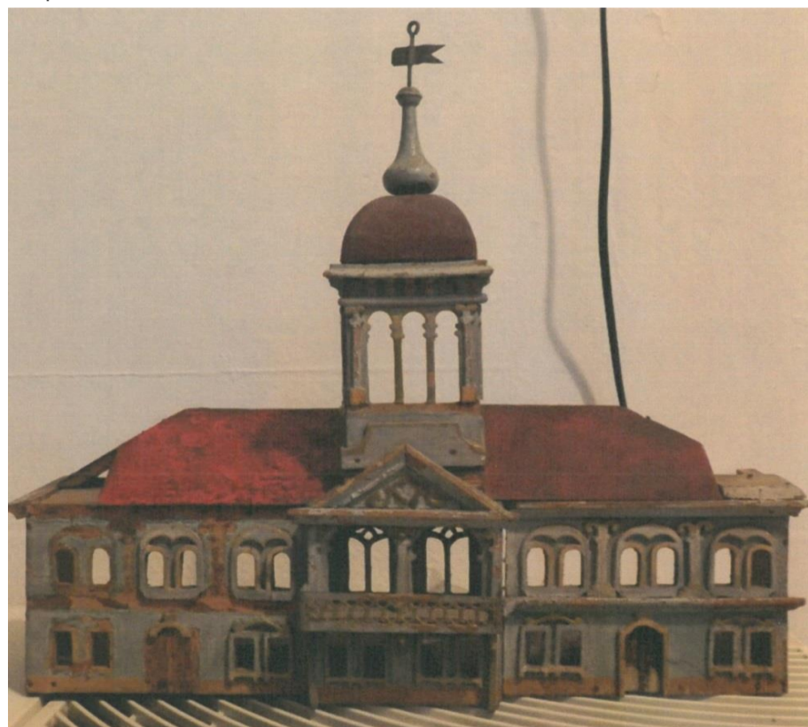
Stav před restaurováním