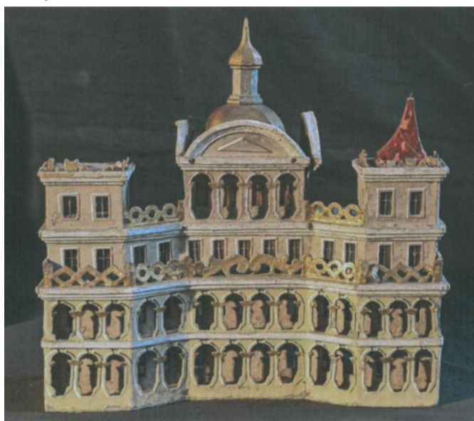
Stav před restaurováním