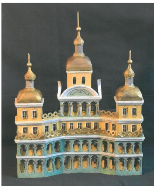
Stav po restaurování