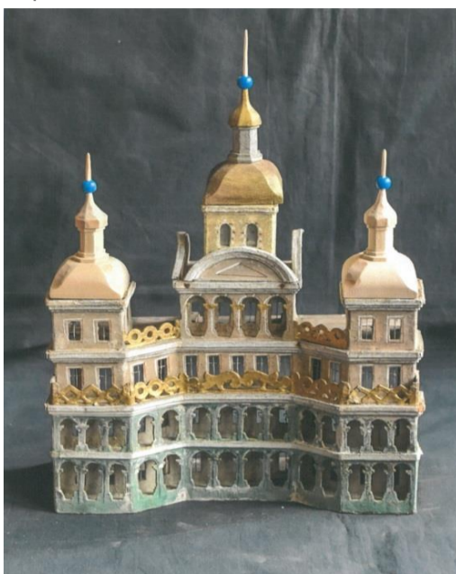
V průběhu restaurování