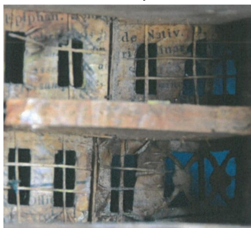
Pohled dovnitř stavby