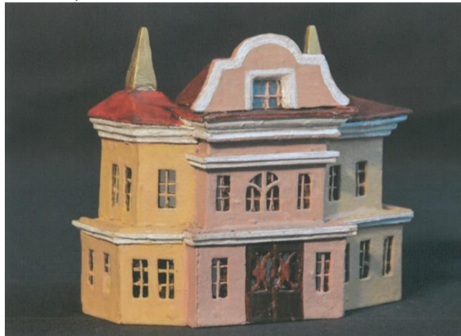
Stav po restaurování