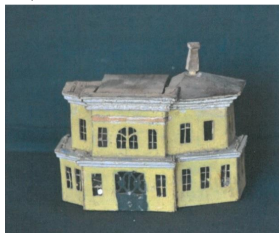
Stav před restaurováním