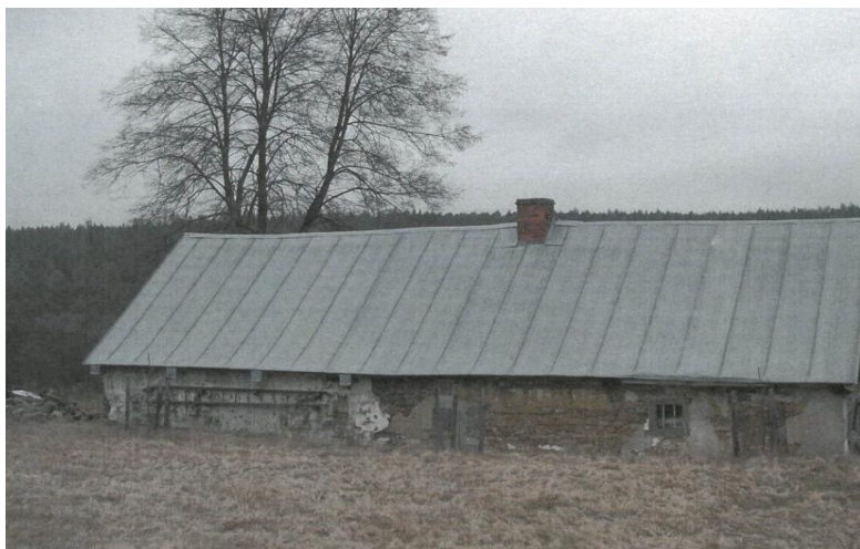
Stav objektu před obnovou