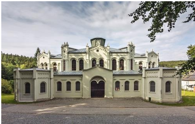
Stav objektu v roce 2014

celkové náklady v r. 2014 - 1 215 tis. Kč