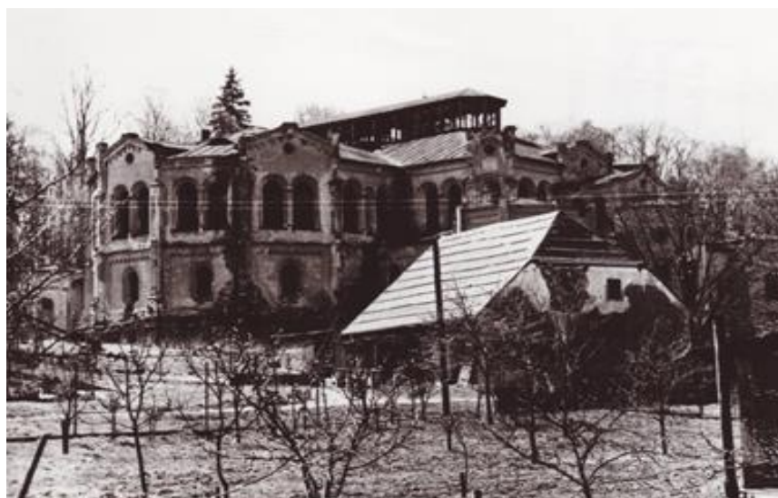
Stav objektu před opravou - historická fotografie

Součástí akce byla i obnova interiéru. Na snímku je pohled z panské lóže do hlavního sálu.